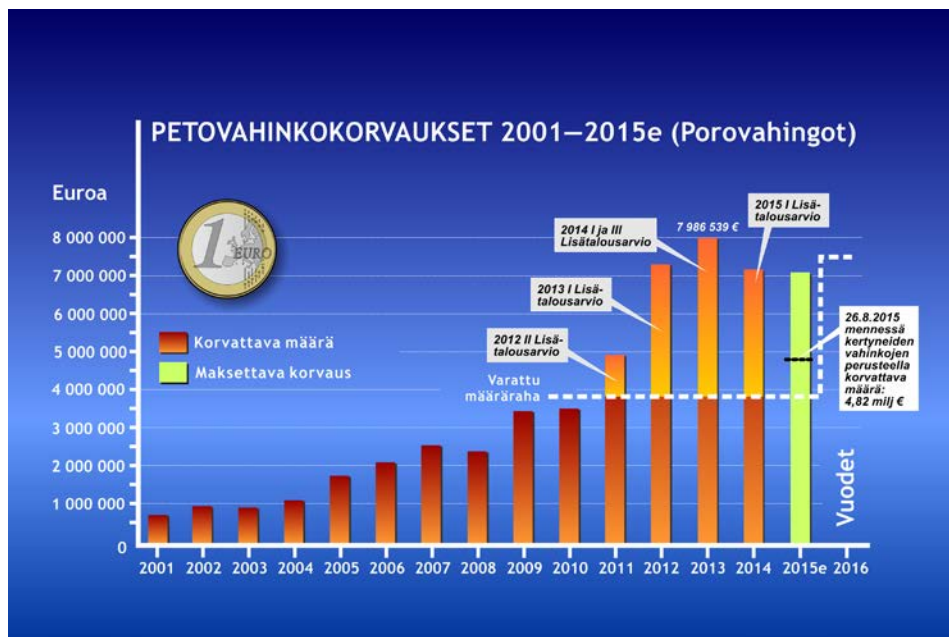
Kuva 2: Porovahinkokorvaukset