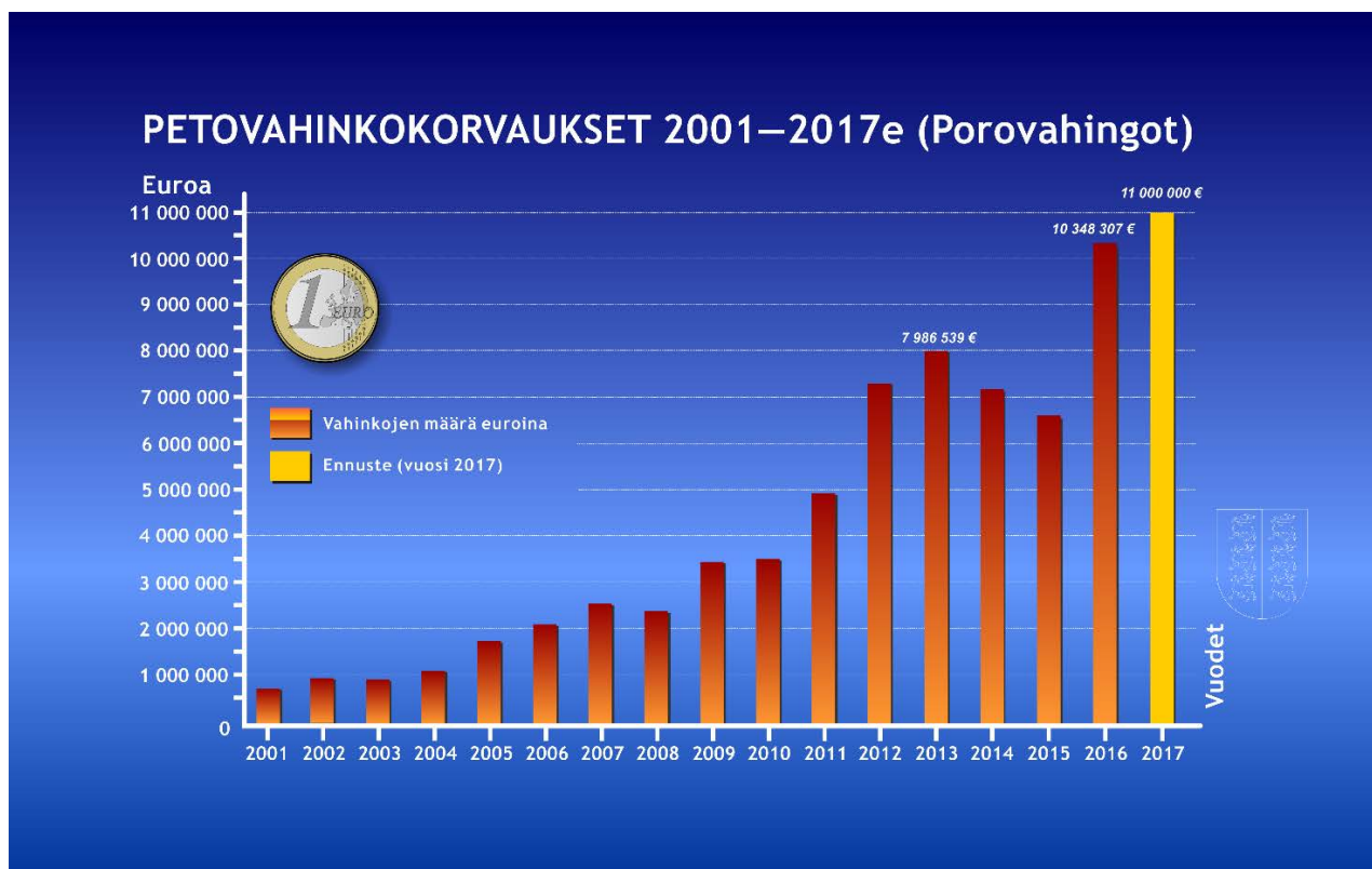
Kuva 2: Poroille aiheutuneiden petovahinkojen korvaukset