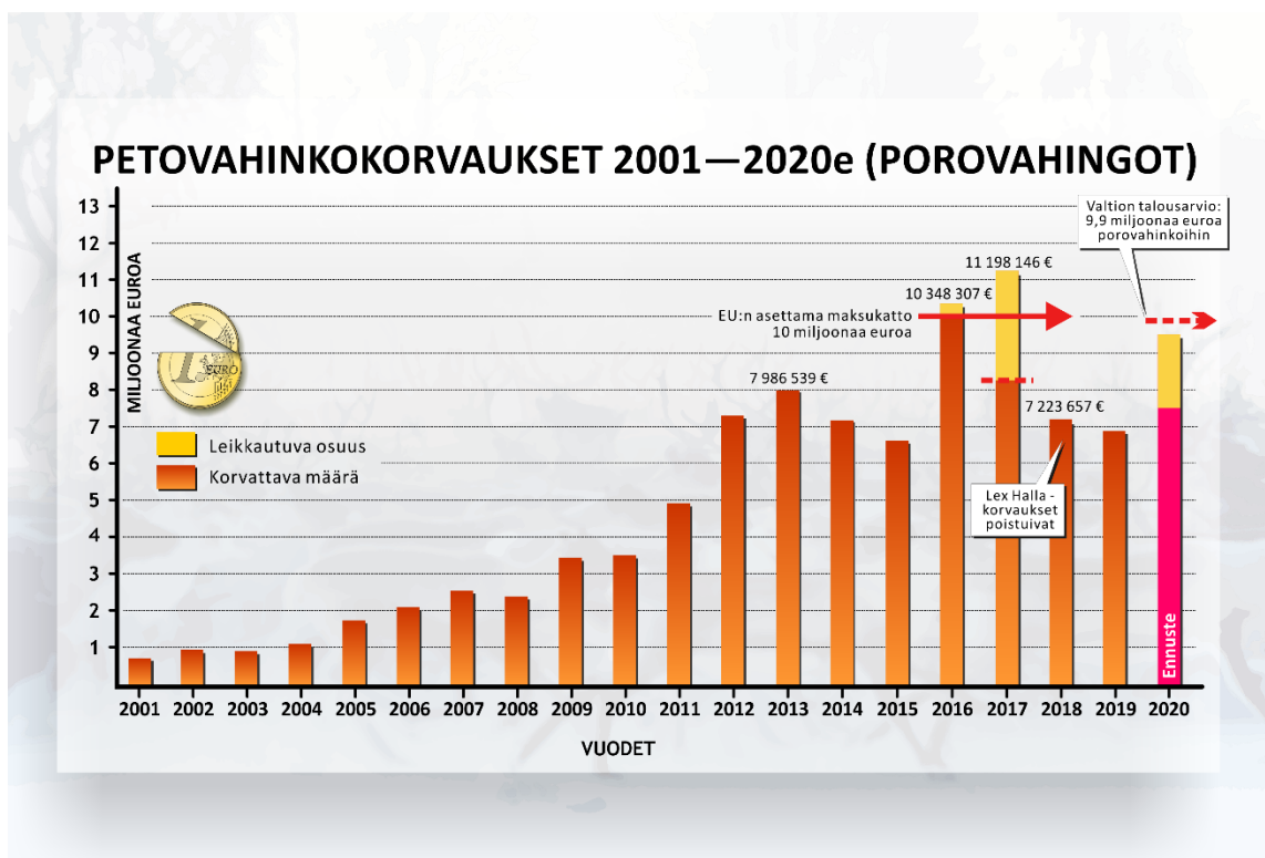
Kuva 2: Poroille aiheutuneiden petovahinkojen korvaukset