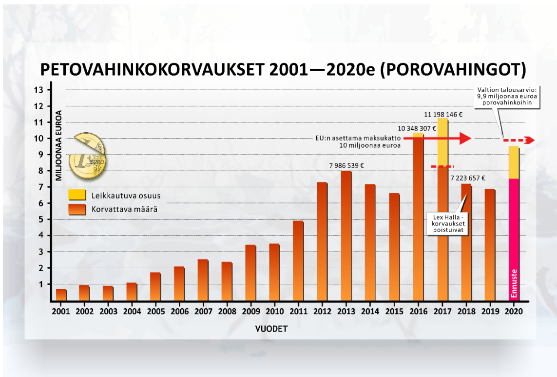
Kuva 2: Poroille aiheutuneiden petovahinkojen korvaukset